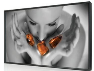
Slim bezel design